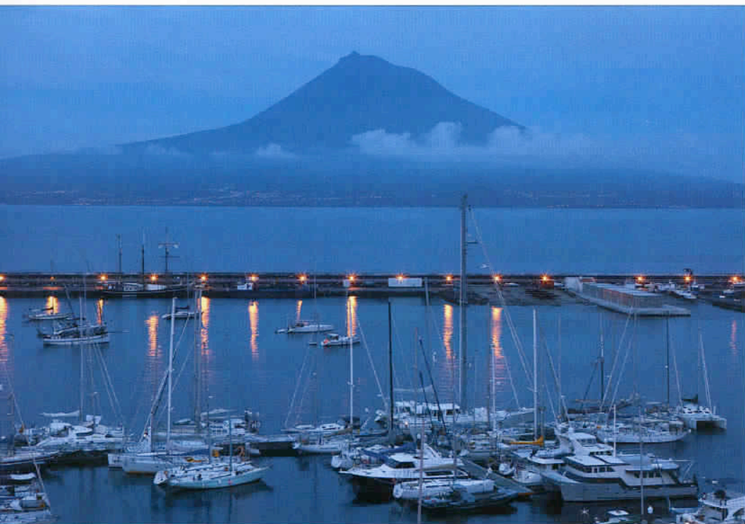
Entre chien et loup, la marina de Horta à Faial, avec en arrière-plan le volcan de Pico, point culminant des Açores.