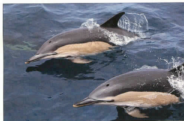
D'extraordinaires dauphins pourtant nommés « communs... ». Leur sport favori : danser et jouer autour des embarcations touristiques. Une expérience inoubliable !