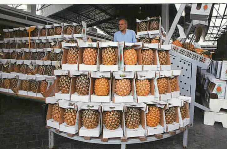
Le marché de Ponte Delgada à Sao Miguel, avec des ananas récoltés aux Açores. Cette production est un délice !