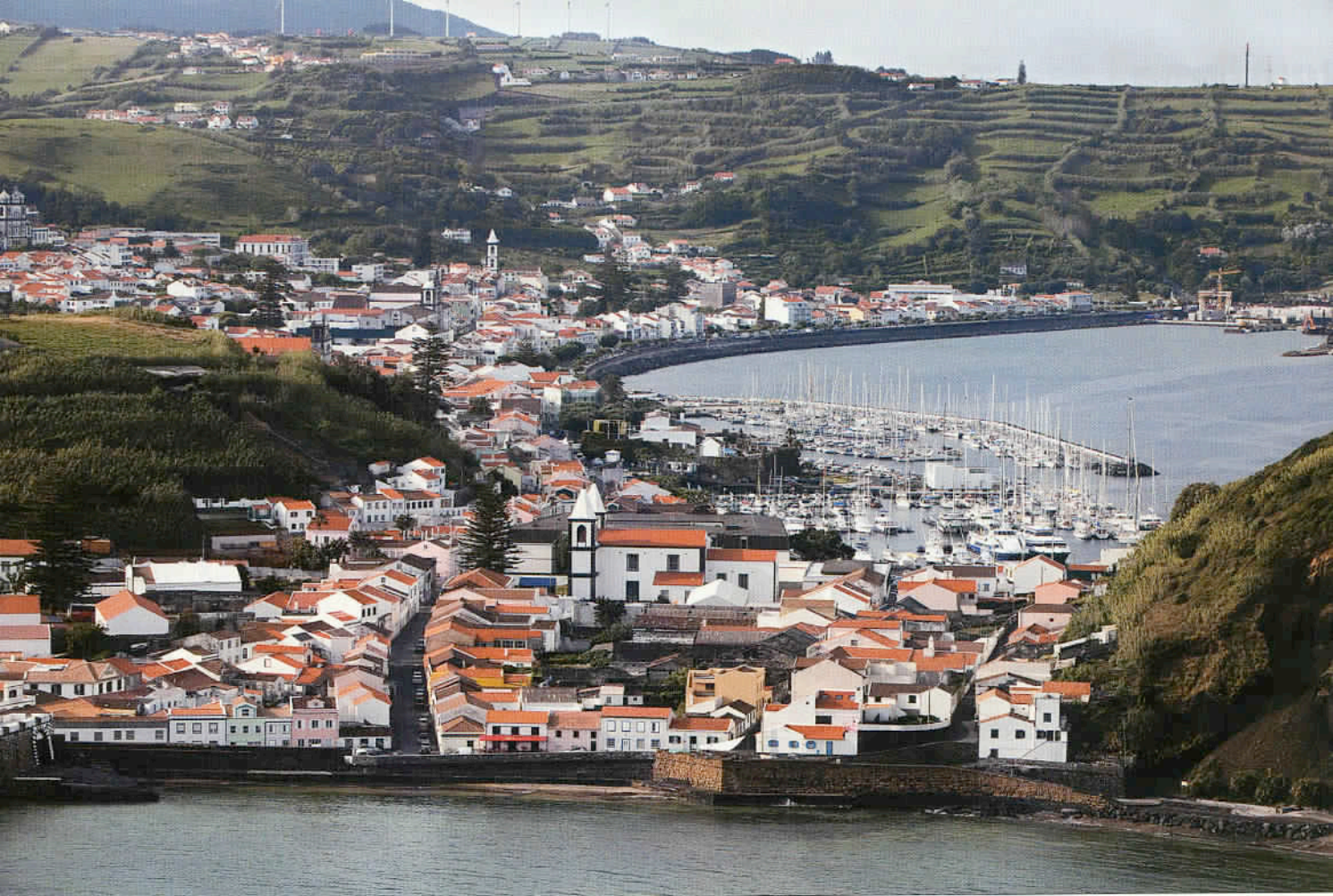
Une vue générale du Port de Horta, la capitale de l'île de Faial. Le point de départ des excursions maritimes pour l'observation des mammifères marins : baleines, cachalots et dauphins.